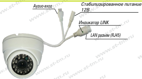
Рис. 1 Схема подключения видеокмеры