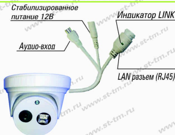
Рис.1 Схема подключения